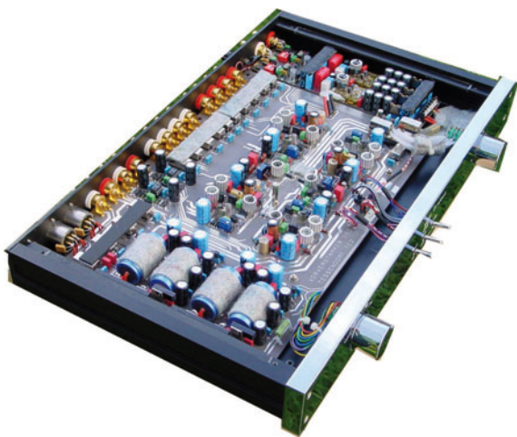
Feine Bauteile, durchdachte Schaltung

Das Äußere des TE 2 präsentiert sich in auffallender Schlichtheit. Die CNC-gefräste, 8 mm dicke Frontplatte mit spiegelverchromten schweren Messingknöpfen und graviert Beschriftung bildet das Antlitz dieser schönen Vorstufe. Die wenigen Bedienelemente des puristisch ausgestatteten Preamps bestehen aus: Links der Eingangswahlschalter, in der Mitte drei Kippschalter (Muting, Pegelabschwächer -3db sowie Source/Monitor) und rechts schließlich der Lautstärkesteller. Die großen, griffigen Drehknöpfe von Eingangswähler und Lautstärkesteller sind aus Vollmaterial (Messing) gedreht. Die damit betätigten Schaltelemente laufen satt und sicher; die drei Kippschalter arbeiten mit jenem „Klick“, der zuverlässige Robustheit beweist und Assoziationen in der Art von „für die Ewigkeit“ vermittelt. Gleiches läßt sich auch von den rückseitigen Anschlüssen sagen: Massive, vergoldete WBT-Buchsen für die high-end-üblichen Anwendungen und je zwei bereits konzeptionell rundum zuverlässige XLR-Buchsen für den symmetrischen CD-Eingang und den symmetrischen Ausgang. Eine stabile Masseklemme komplettiert die sachgerechten Anschlußmöglichkeiten. Betrachtet man den Innenaufbau, schlägt das Herz gleich schneller: Sorgsamer Aufbau, piekfeine Bestückung mit besten elektronischen Bauteilen: das erfreut das Auge des Kenners. Die gesamte Elektronik ruht in einem konstruktiv stabilen Gehäuse und ist resonanzarm „verpackt“.