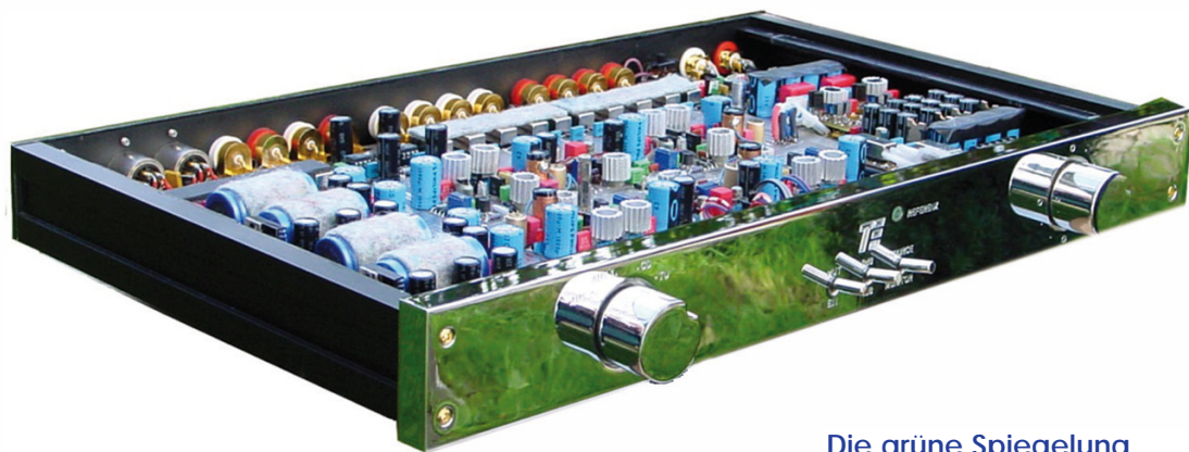
Die grüne Spiegelung einer Rasenfläche zeigt die Qualität der Verchromung des TE 2

Fernbedienungen werden bei Tessendorf-Verstärkern grundsätzlich nicht verwendet, weil nach Aussage von Siegbert Tessendorf bei der Schaltungsrealisierung Bauelemente Verwendung finden, die zur Verschmutzung der Betriebsspannung und der Betriebsmasse führen. Genauso wenig werden getaktete Netzteile in seinen Verstärkern eingesetzt. Diesbezüglich gab es in „L’Audiophile Nr. 27“ eine eingehende Untersuchung von Jean